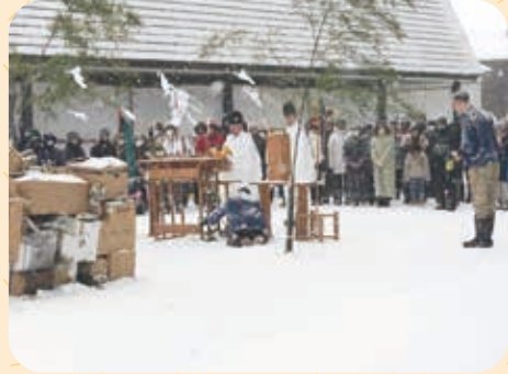
古いお札・お守りや正月飾りなどをお焚き上げいたしました。