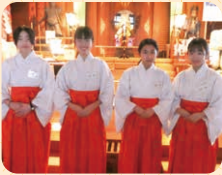
秋田大学附属中学校 職場体験 (十二月〜四月)