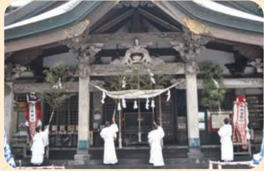
煤払式 (十月十三日)