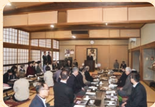
神武館三十周年記念祝賀会 (三月十四日)