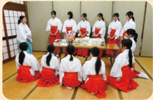
巫女説明会 (十月二十日)