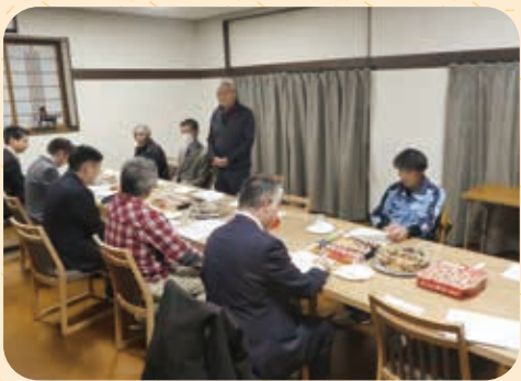
協力会打合せ (十二月十日)