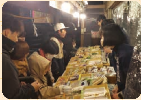
三ヶ日九六、〇〇〇名のご参拝を頂きました。